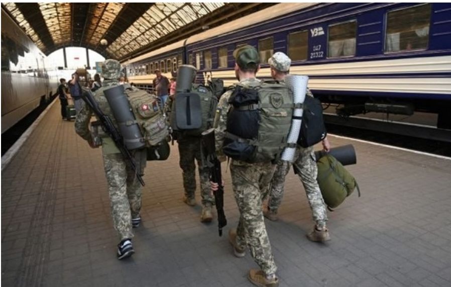
В Україні готують реформу мобілізації

Міністерство оборони розробило законопроект щодо зміни процесу мобілізації. Реформа буде представлена протягом місяця.