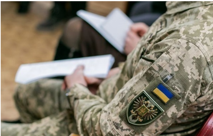
Фото: Чернігівський обласний ТЦК та СП (ілюстративне фото) В Україні можуть створити Офіс призову замість ТЦК

Йдеться про розділення нинішніх функцій на дві частини: соціальну та безпосередньо мобілізаційну.