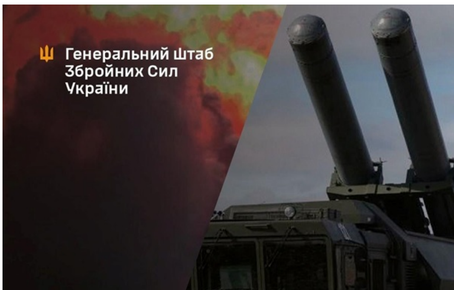
Під ударами нафтобази і російські Bastioni

Також завдано ударів по позиційному району берегового ракетного комплексу Bastion біля Софіївки в Криму.