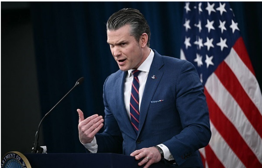
Очільник Пентагону Піт Гегсет

Гегсет заявив, що Збройні сили США завершили свою операцію в Ірані, але готові її продовжити, якщо знадобиться.