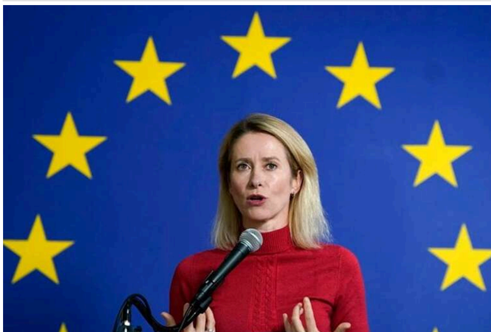
ЄС може ухвалити рішення про позику Україні на 90 мільярдів євро протягом 24 годин, – Каллас

Рішення щодо надання Україні позики ЄС на суму 90 млрд євро буде ухвалене протягом "наступних 24 годин". Також ЄС найближчим часом перегляне раніше "заблоковані рішення, включно з відкриттям кластерів переговорів з Україною" для її вступу у ЄС.