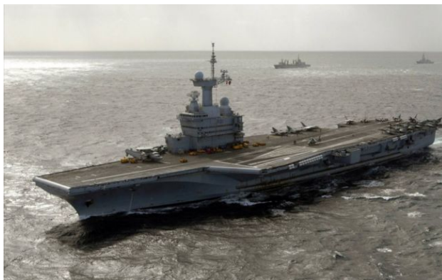
Фото: Французький авіаносець Charles De Gaulle (Вікімедіа)

Обирайте перевірене - додайте РБК-Україна до улюблених джерел у Google