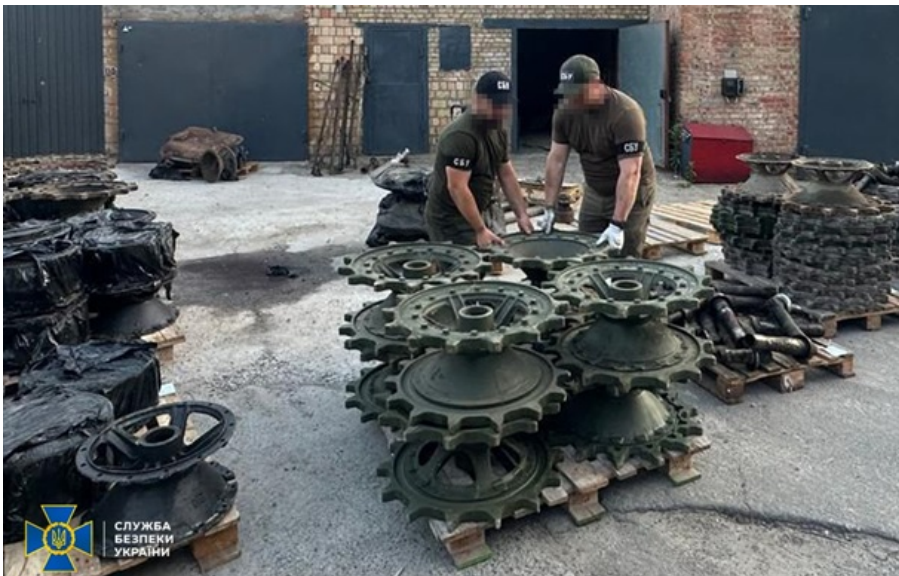
СБУ та ДБР передали на фронт комплектуючі до бронетехніки ЗСУ на 20 млн

Зокрема, мовиться про 109 палетів із запчастинами до важкого озброєння на 20 млн грн.