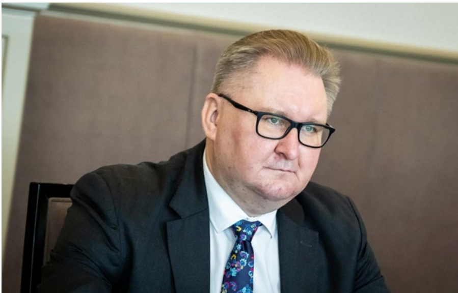
Віце-прем'єр з європейської та євроатлантичної інтеграції Тарас Качка

Засідання Ради ЄС 17 березня було присвячене передачі Україні умов вступу, але Будапешт не мав заперечень.