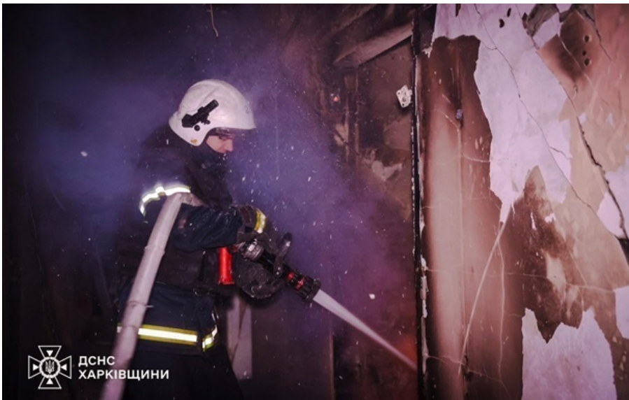
Фото: (архивне фото) В Харькове ракета РФ попала в многоквартирный дом

Кроме ракетного удара по девятиэтажному дому, в Киевском районе города зафиксировано попадание беспилотника.