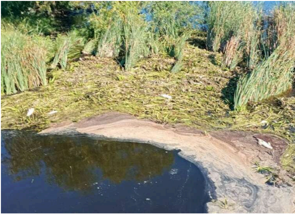
Масовий мор худоби та рейдерство: на Житомирщині селяни виявили таємний могильник тварин

Масовий мор худоби в ДП «Рихальське» на Житомирщині намагаються приховати, – ЗМІ.