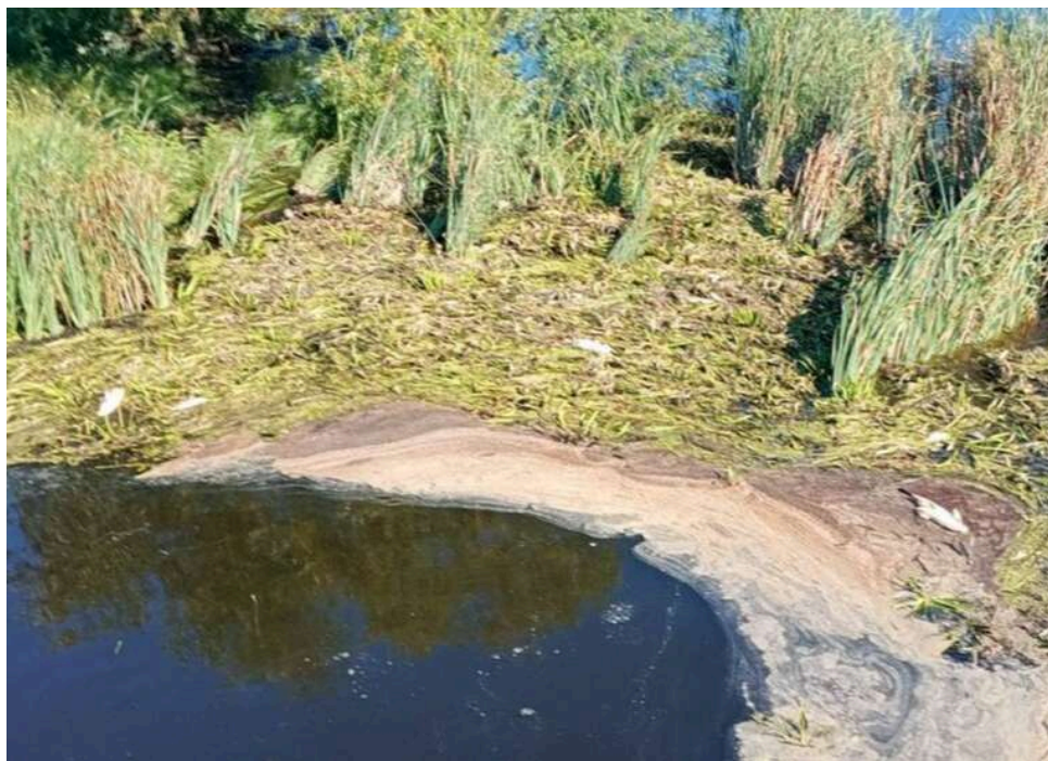
Масовий мор худоби і рейдерство: на Житомирщині селяни виявили таємний могильник тварин

Масовий мор худоби в ДП «Рихальське» на Житомирщині намагаються приховати, – ЗМІ.