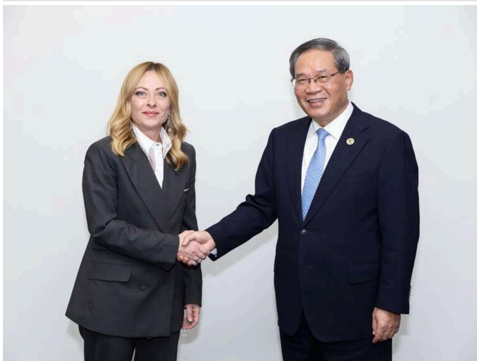
Пекін використовує розбіжності між Римом і Вашингтоном для зближення з Італією

Пекін активізує дипломатичні та економічні контакти з Римом на тлі зростаючих розбіжностей між США та Італією в період політичних ініціатив Дональда Трампа.