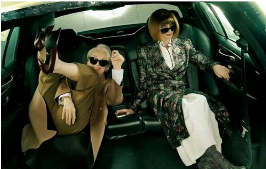
Анна Вінтур та Меріл Стріп

Глядачі соцмереж активно створюють мему, порівнюючи образи героїнь із Мірандою Прістлі.