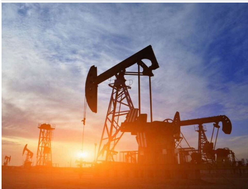
Bloomberg: Росія нарощує експорт нафти після зниження ефекту атак українських дронів