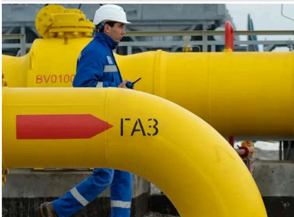
Газовий демпінг для Пекіна: Китай купуватиме російський газ на 38% дешевше, ніж Європа

Росія в найближчі роки планує постачати природний газ Китаю приблизно на третину дешевше, ніж Європі.