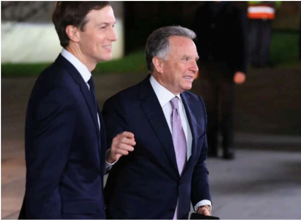
Переговори США–Іран під питанням: Віткофф і Кушнер залишаються у Вашингтоні

Американські перемовники з Іраном Віткофф і Кушнер досі перебувають у США.