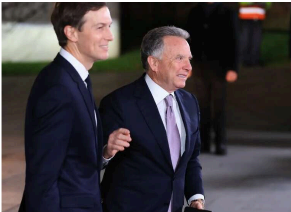
Переговори США–Іран під питанням: Віткофф і Кушнер залишаються у Вашингтоні

Американські перемовники з Іраном Віткофф і Кушнер досі перебувають у США.