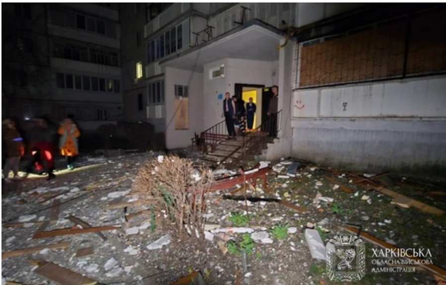
Последствия российской атаки на Харьков

По городу и области наносились удары дронами различных типов, управляемыми авиабомбами, также был нанесен ракетный удар.