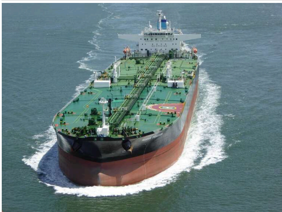
Шахраї почали «продавати прохід» через Ормузьку протоку за криптовалюту, – Reuters

Шахраї шукали судновласників на оплату проходу через Ормузьку протоку.