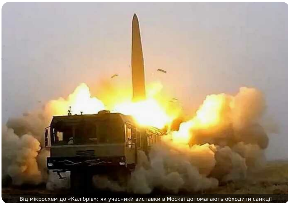
Від мікросхем до «Калібрів»: як учасники виставки в Москві допомагають обходити санкції

До триденної виставки ExproElectronica 2026 (14 по 16 квітня) у Російській Федерації долучилось понад 700 компаній, які опосередковано чи безпосередньо причетні до виробництва російської зброї, встановили розслідувачі. Серед них виділяється фірма, яка контактує з трьома компаніями військово-промислового комплексу РФ та ракетами "Іскандер", "Калібр". Які саме посередники забезпечують роботу російського ВПК та потрапили до бази даних аналітиків?