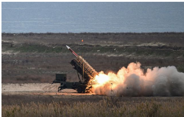
фото: система ППО Patriot (Getty Images)

За кілька тижнів війни з Іраном США витратили значну частину своїх ракетних запасів. Йдеться про ключові системи, відновлення яких може тривати роками.