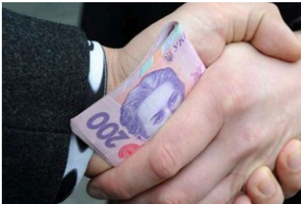
Кандидат до ВАКС під підозрою: суддя Іван Посохов «допомагав» колезі зі столиці отримати хабар

Судді Сіверськодонецького міського суду Луганської області Івану Посохову повідомили про підозру в підбуренні адвоката до надання коштів судді столичного суду.