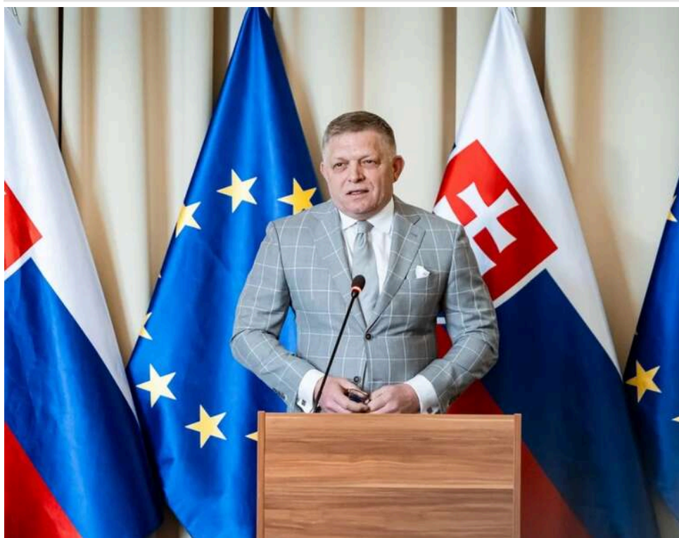
Прем'єр Словаччини Фіцо звернувся до Польщі з проханням дозволити проліт до Москви на 9 травня

Польща отримала запит, у якому Словаччина просить пропустити через польський повітряний простір літак свого прем'єр-міністра Роберта Фіцо, який 9 травня планує відвідати парад у Москві.