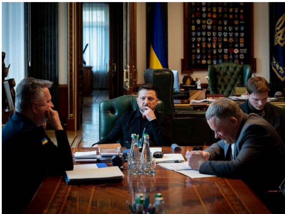
Зеленський обговорив з лідерами ЄС розблокування 90 мільярдів євро допомоги для України