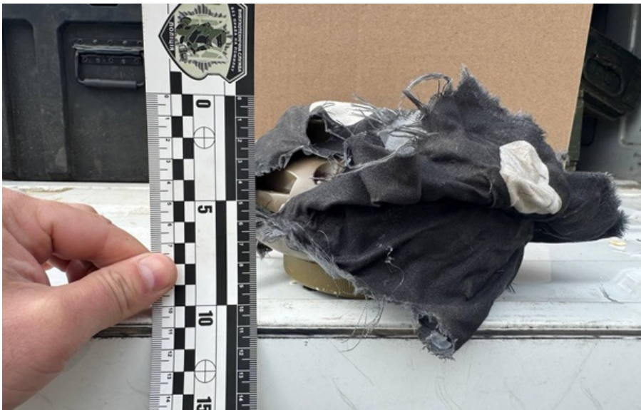
Нова міна росіян

Цивільним категорично забороняють наблизитися до вибухонебезпечного предмета ближче ніж на 30 метрів, торкатися його або переміщати.