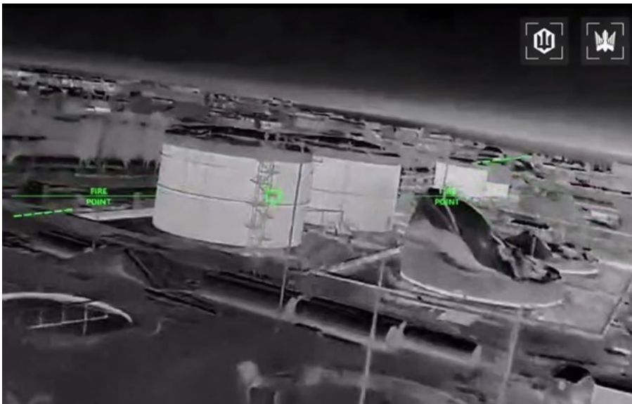
Фото: Скріншот Українські дрони добивають нафтобазу в Феодосії