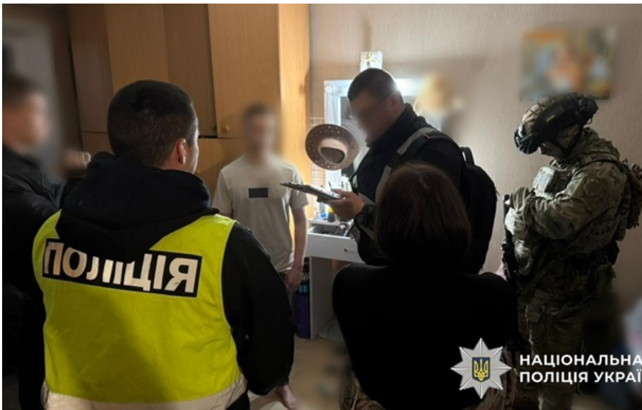
Нацполіція зірвала канал наркопостачань з ЄС