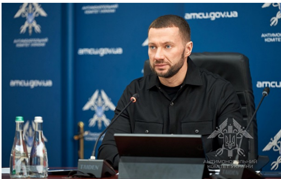
Павло Кириленко не бачить змови на ринку пального

Facebook 0 Twitter 0 ЧИТАТИ НОВИНУ РОСІЙСЬКОЮ 👁 23