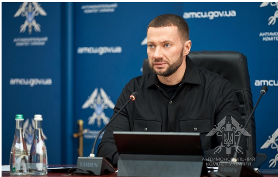
Павло Кириленко не бачить змови на ринку пального

Усі без винятку оператори ринку зазначають, що обсяги їх продажів та їх рентабельність відчутно знизилися, тому вони самі зацікавлені й готові знизити ціни, запевнив Павло Кириленко.