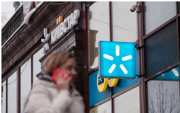
Фото: користувачі "Київстару" повідомляють про проблеми зі зв'язком

У роботі найбільшого мобільного оператора України "Київстар" стався масштабний збій.