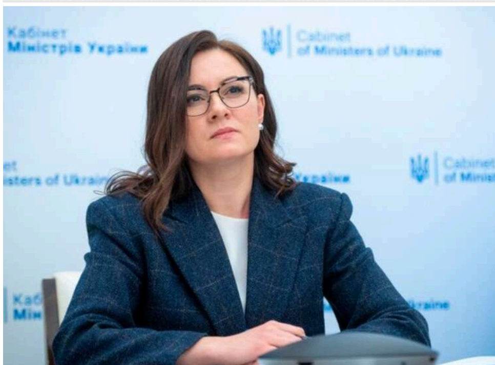
Відмова від прозорих конкурсів: Уряд вилучає пункти про відбір керівництва Нацполіції та ДБР з Антикорстратегії