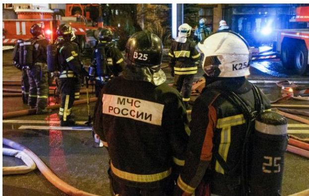
Фото: російські пожежники (Getty Images)

Масштабна пожежа на НПЗ у російському Туапсе спричинила густий дим, який розтягнувся на сотні кілометрів. Зафіксовано, що він досяг території Ставрополя.