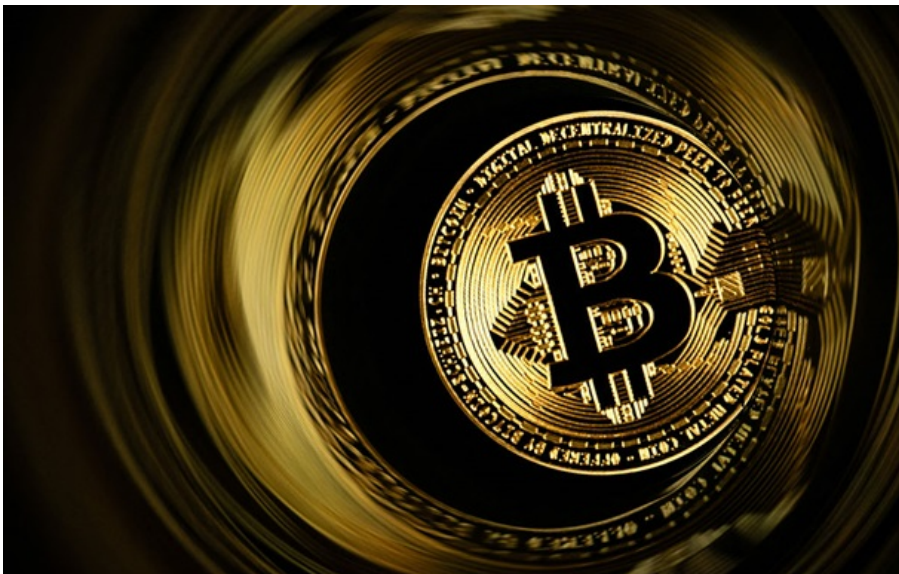
Bitcoin зріс до понад $71 000

Bitcoin повторив зростання акцій і золота після того, як президент США Дональд Трамп оголосив про відтермінування удару по Ірану на два тижні.