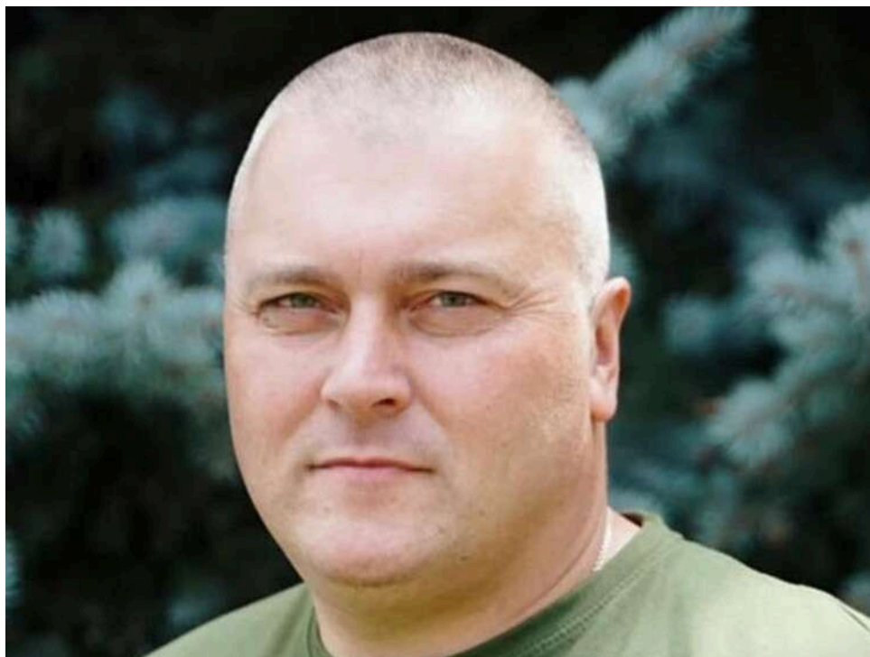
Тіні Кіровоградщини над Полтавою: як нова команда Дяківнича перерозподіляє мільярдні підряди

Після призначення Віталія Дяківнича головою Полтавської ОВА на початку 2026 року в регіоні не відбулося відмови від скандальних підрядників. Відбулася зміна кураторів і перерозподіл тіньових доходів. Компанії, які вже фігурували в кримінальних історіях, зберегли позиції та збільшили обсяги фінансування.