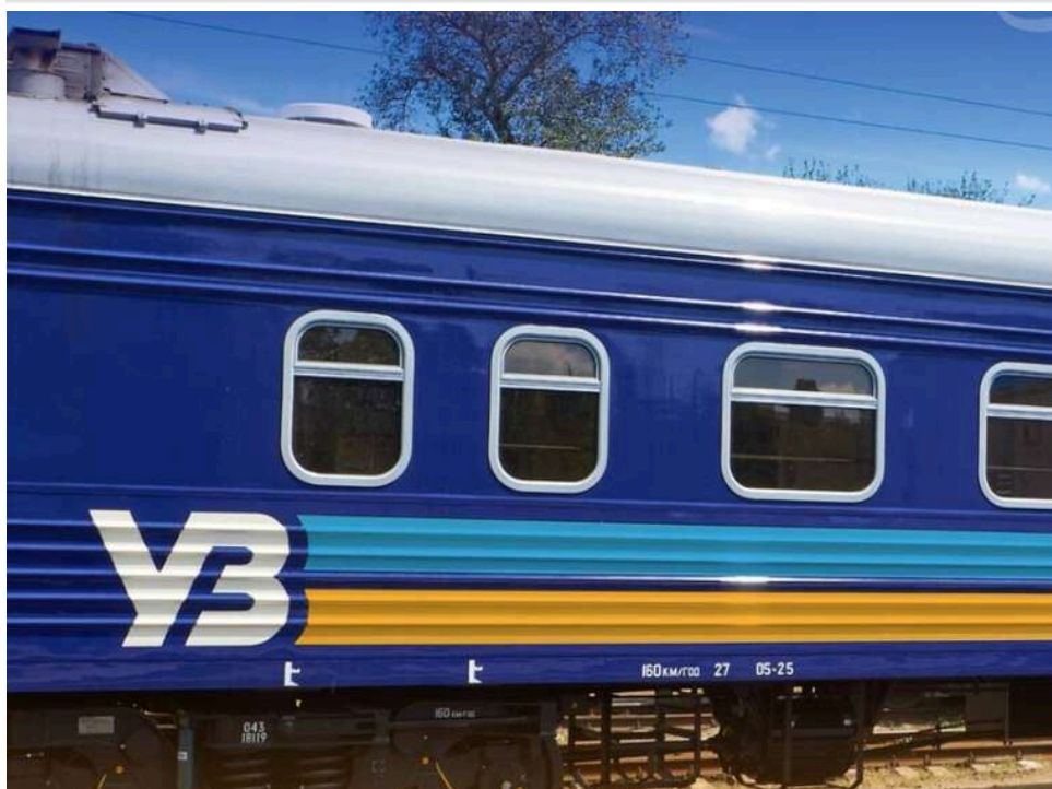
Мільйони на страхуванні пасажирів: як «Укрзалізниця» роками «годує» приватну компанію без тендерів