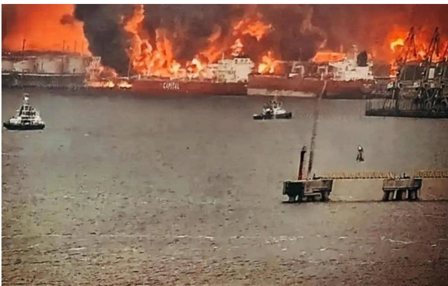
Наслідки нальоту українських дронів в порту Усть-Луга Ленінградської області

Рішення було ухвалено за підсумками засідання регіонального оперштабу за участю федеральних чиновників та силовиків.