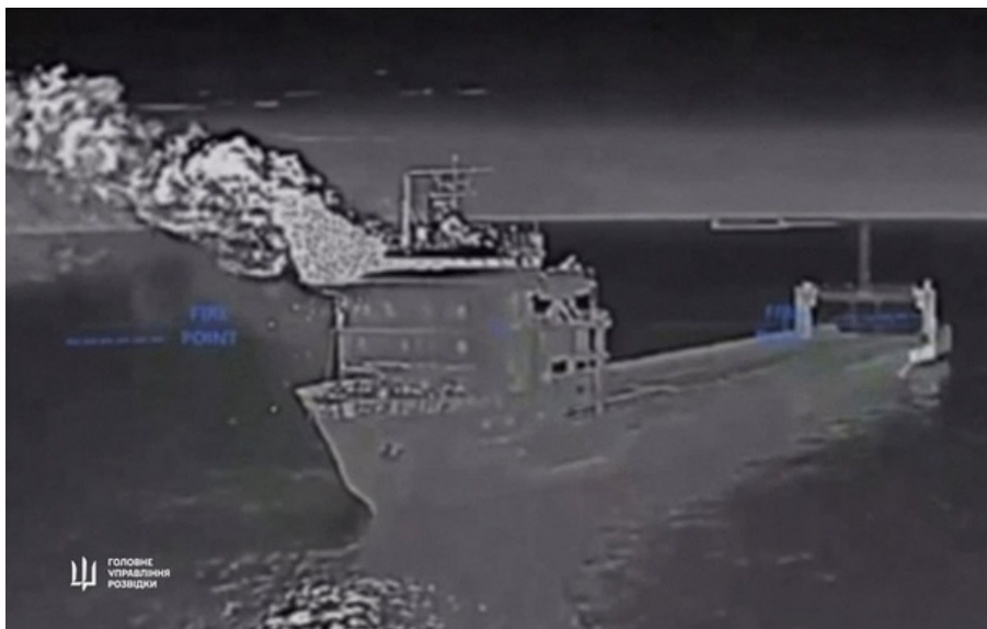
Пором Славянін "прикурує" в Керченській протоці

Пором Славянін відіграв важливу роль у забезпеченні російського військового контингенту в тимчасово окупованому Криму.