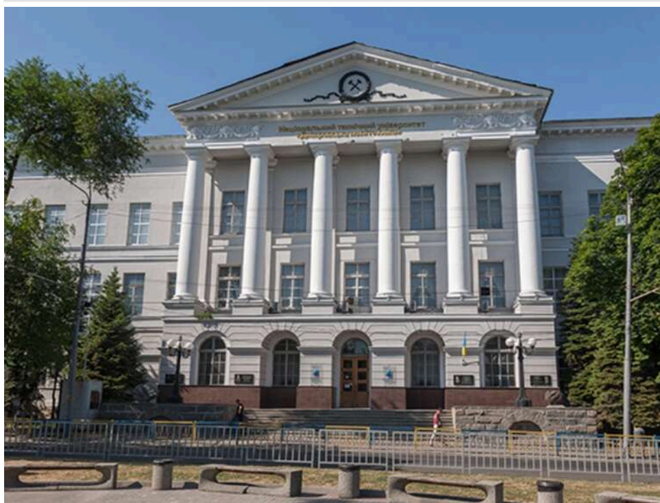
Переплата у 100%: поліція розслідує закупівлю енергообладнання «Дніпровською політехнікою»

Слідчий суддя Чечелівського районного суду міста Дніпра надав правоохоронцям дозвіл на тимчасовий доступ до документів та інформації, необхідних для розслідування справи про можливе привласнення коштів на закупівлі системи накопичення електричної енергії, яку здійснила «Дніпровська політехніка».