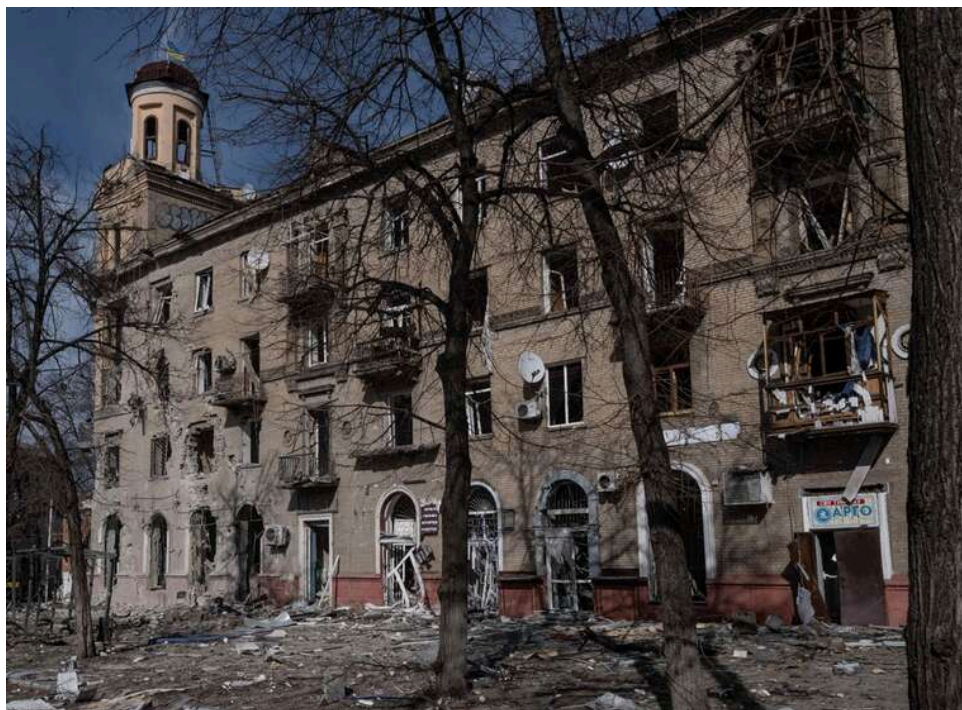
Окупаційна влада заявила про плани відновлення низки міст на Донбасі за кошти РФ