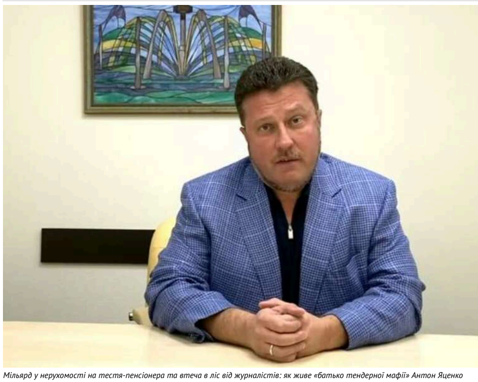
Мільярд у нерухомості на тестя-пенсіонера та втеча в ліс від журналістів: як живе «батько тендерної мафії» Антон Яценко

Депутат-схемник Антон Яценко – майже два десятиліття в українській політиці, п'ять партій і депутатських груп, мільярд гривень у нерухомості на родичів – і жодного вироку. Ще з початку 2000-х Антона Яценка називають «батьком тендерної мафії».