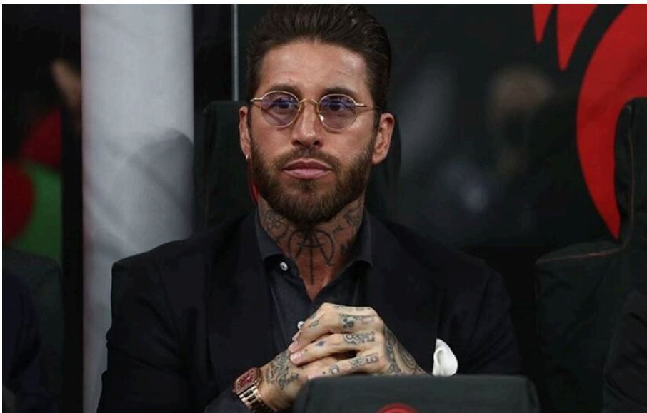
Серхіо Рамос

Рамос також опублікував пост у своїх соцмережах, де він має багатомільйонну аудиторію, з нагадуванням про війну.