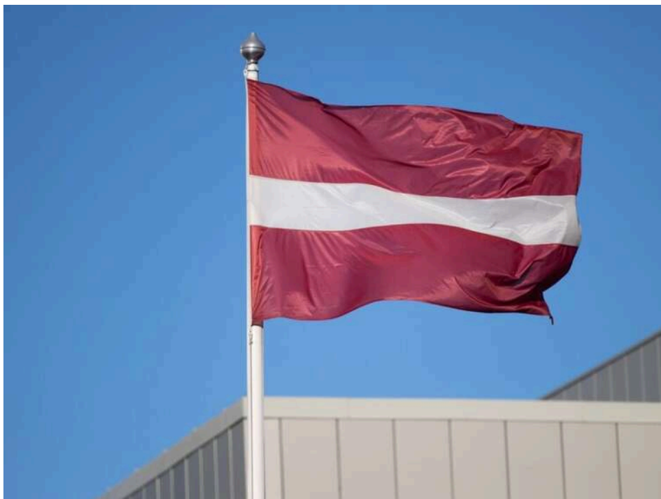
Латвія заблокувала ще 10 сайтів через поширення російської пропаганди

Національна рада з електронних ЗМІ Латвії обмежила доступ ще до десяти інтернет-сайтів, які поширюють російську пропаганду. Рішення ухвалили після отримання інформації від державних органів, і воно вже оприлюднене в офіційному виданні.