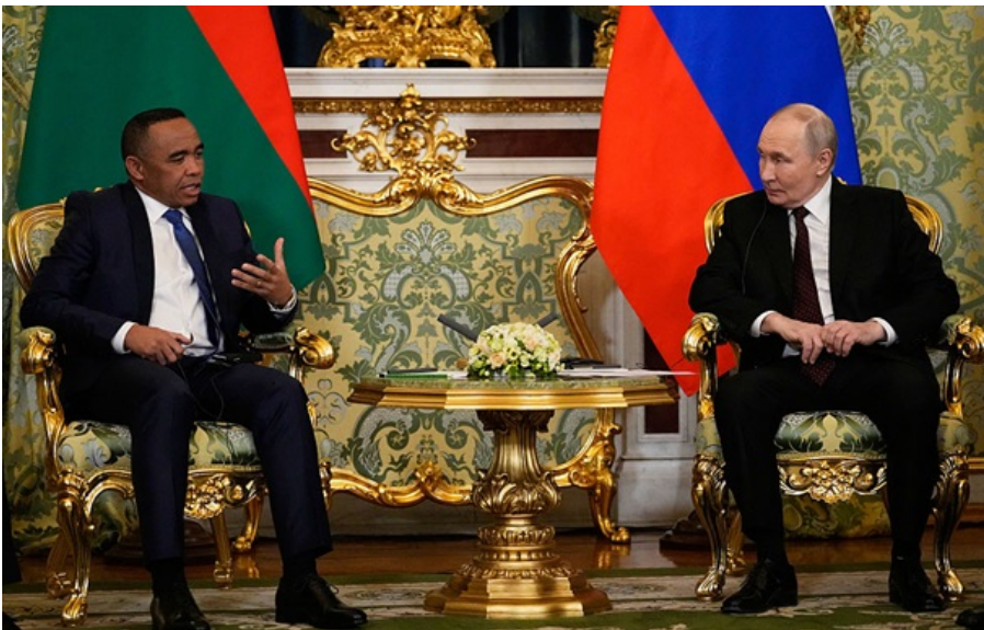
Володимир Путін та президент Мадагаскару Міхаель Рандріаніріна

Росія нарощує військову та політичну співпрацю з Мадагаскаром, скориставшись зміною влади після перевороту восени 2025 року, поки США відволікаються на війну проти Ірану.