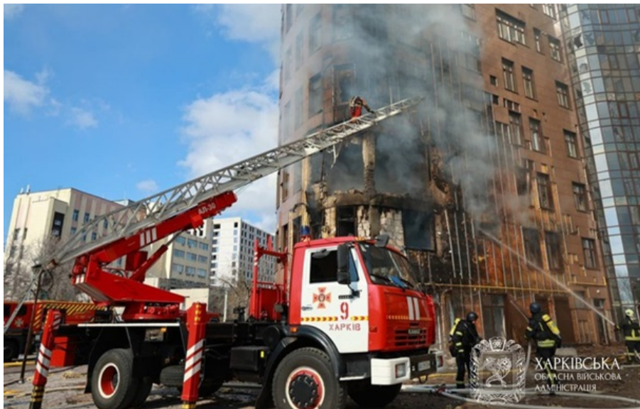
Последствия российского обстрела

На данный момент известно о двух пострадавших, в частности 61-летняя и 52-летняя женщины получили травмы от взрыва.