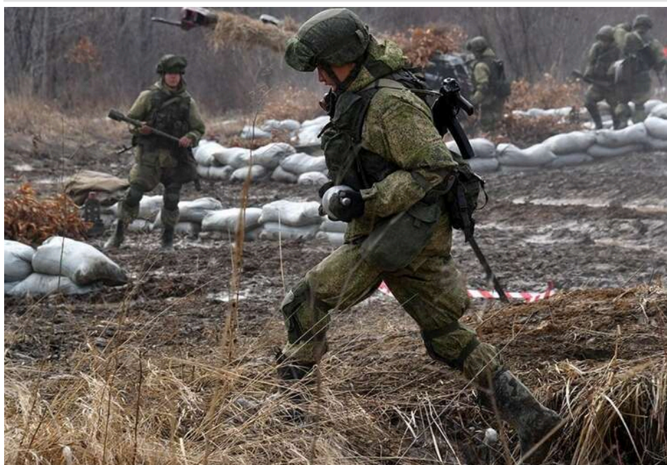
Ситуація на фронті: 91 атака РФ за добу, найгарячіше на Покровському напрямку

Станом на 16:00 21 квітня кількість атак росіян сягнула 91.