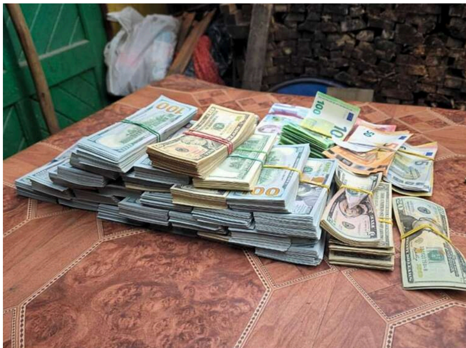
Мільйони під подушкою: на Закарпатті голову ВЛК затримали з готівкою на 11 мільйонів гривень

На Закарпатті затримали керівника ВЛК, у якого вилучили готівку на суму близько 11 млн грн.