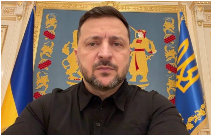
Володимир Зеленський вчоргове закликав Росію припинити вогонь