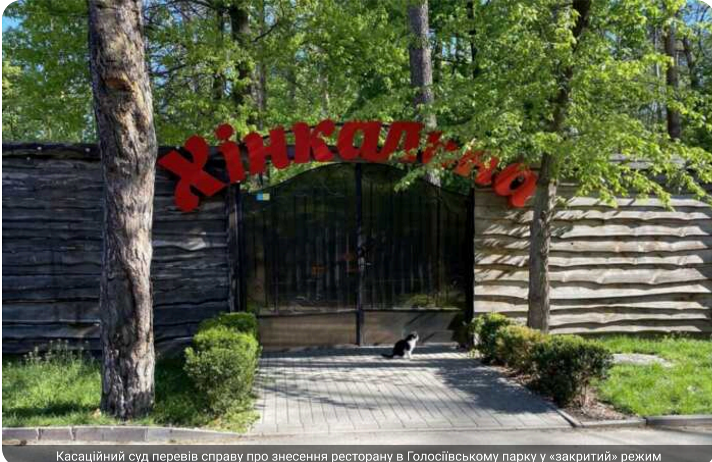
Касаційний суд перевів справу про знесення ресторану в Голосіївському парку у «закритий» режим

Навколо резонансної справи щодо знесення незаконного ресторану у Національному парку "Голосіївський" розгортається сценарій "тихого" правосуддя. Попри значний суспільний резонанс, розгляд справи у Касаційному цивільному суді фактично перейшов у закритий режим.