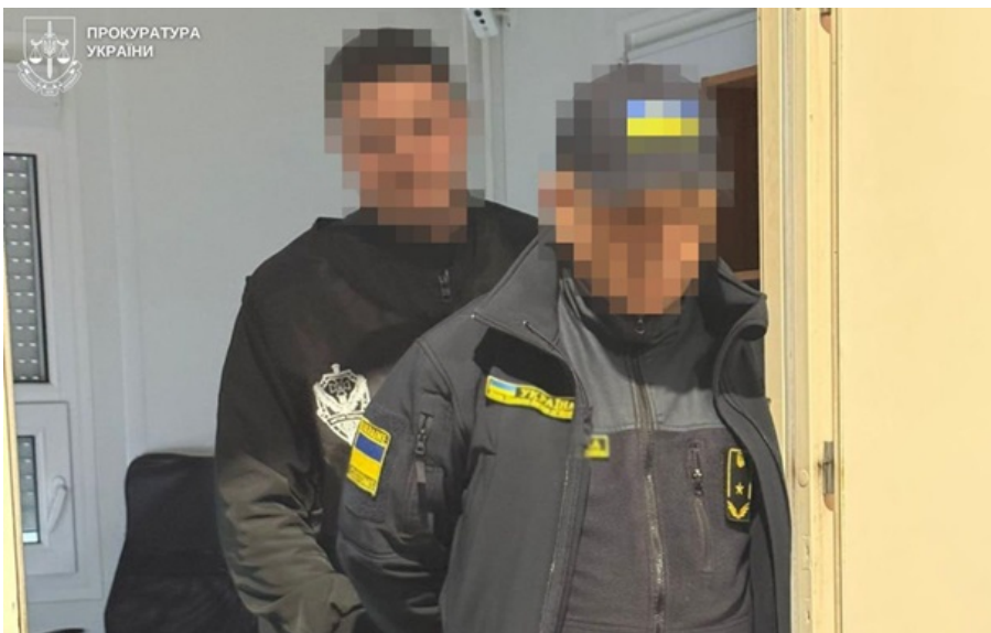
Митнику повідомили про підозру

Митник за гроші забезпечував безперешкодний виїзд до Польщі без декларування готівки та проходження митних формальностей.