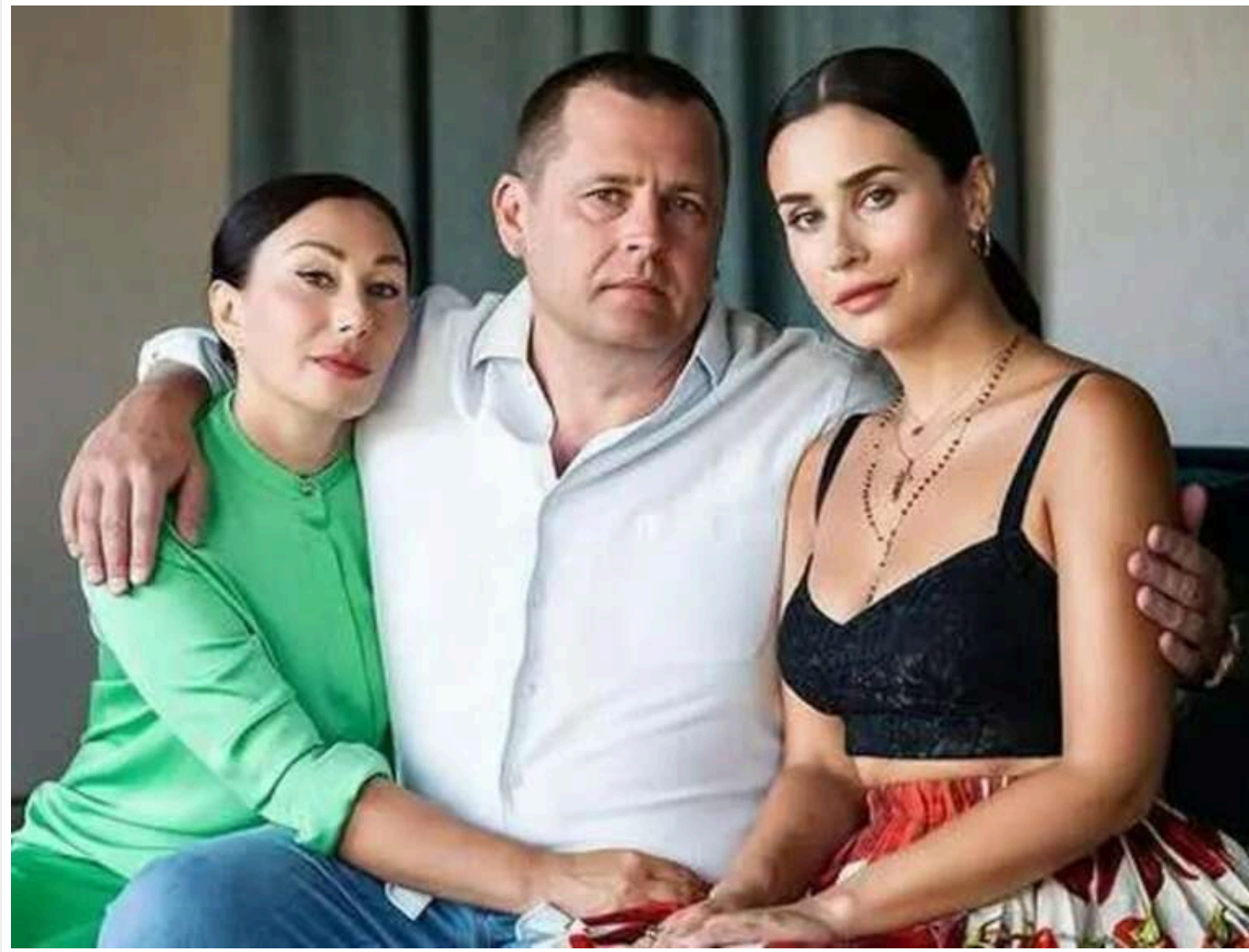
Вілла на Комо за 8 мільйонів євро: у мережі з'явилися дані про майно доньки мера Дніпра, Філатов назвав це російською ІПСО